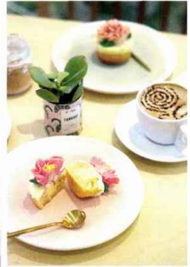
Bon Bouquet, ici les décors des gâteaux petits ou grands sont réalisés en forme de fleurs ou de plantes selon une technique venue de Corée du Sud.